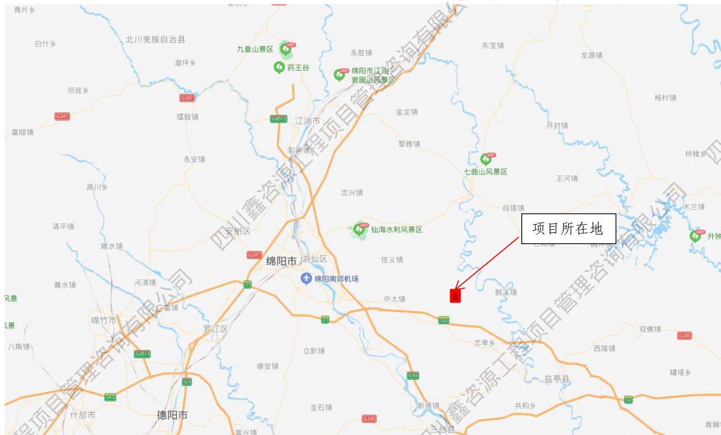
附图1 项目地理位置示意图