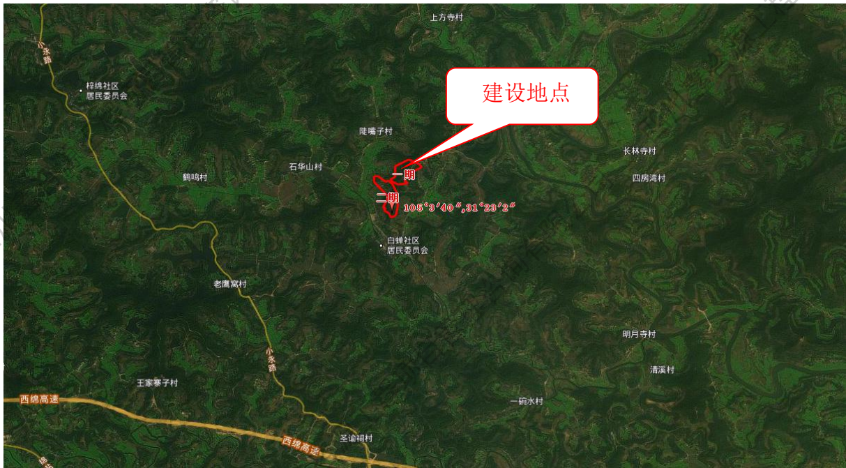
图 2-1 地理位置图