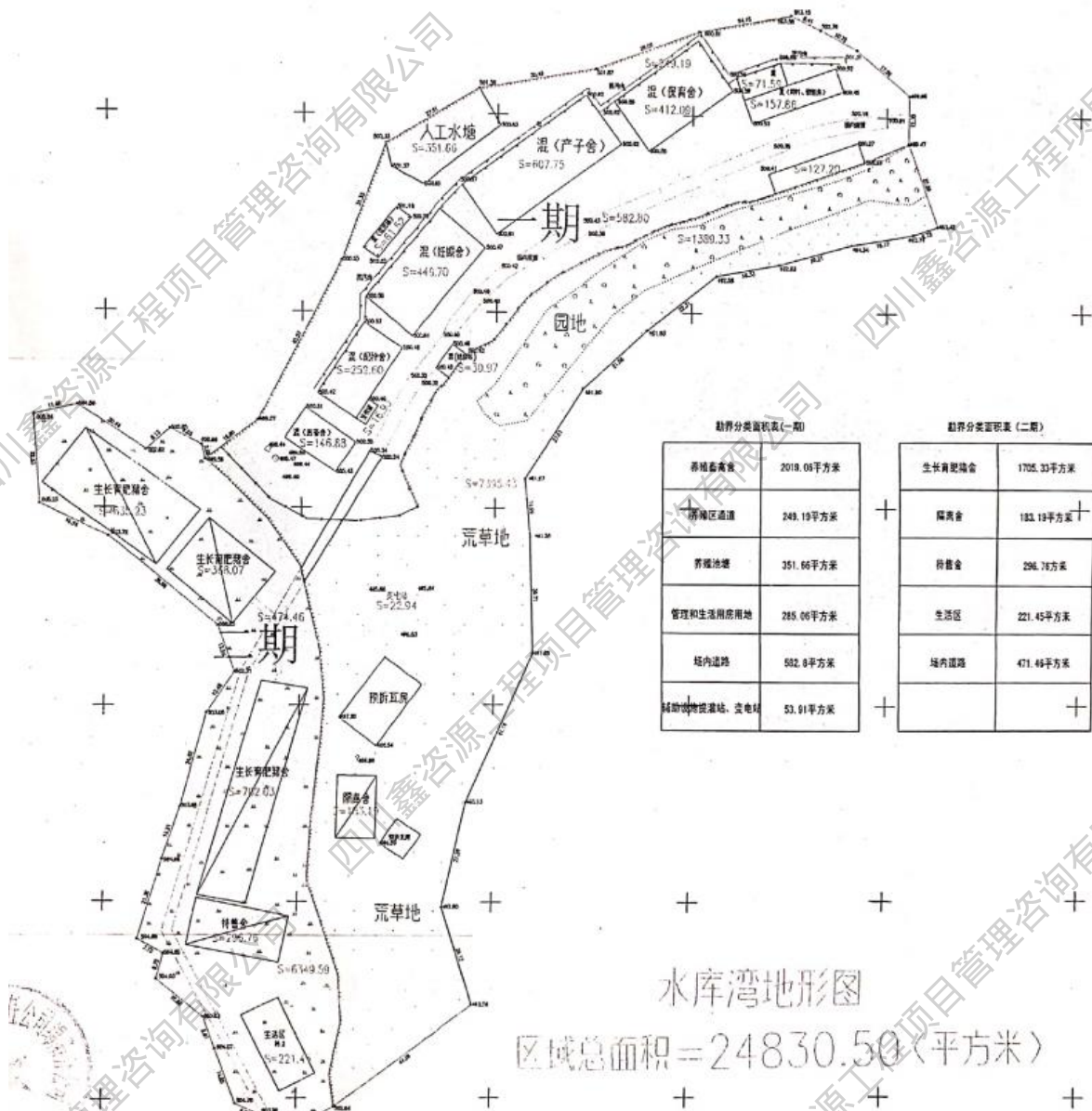
图 2.2-1 项目总平面布置图