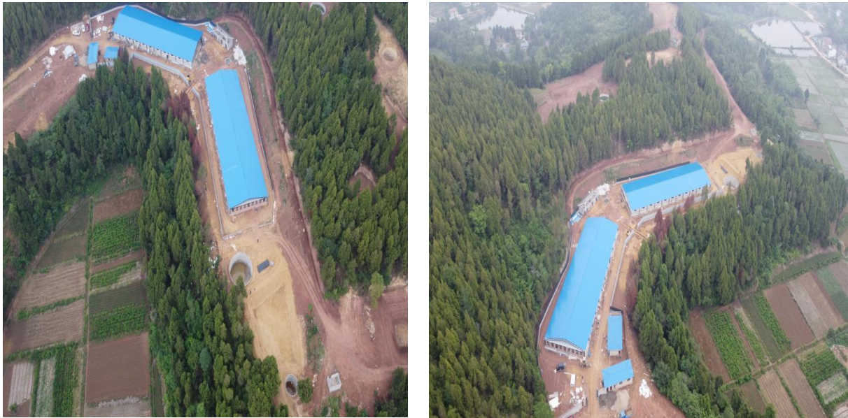
图 2-2 项目现状

本项目已于 2021 年 3 月开工，计划于 2021 年 7 月完工，总工期 5 个月。