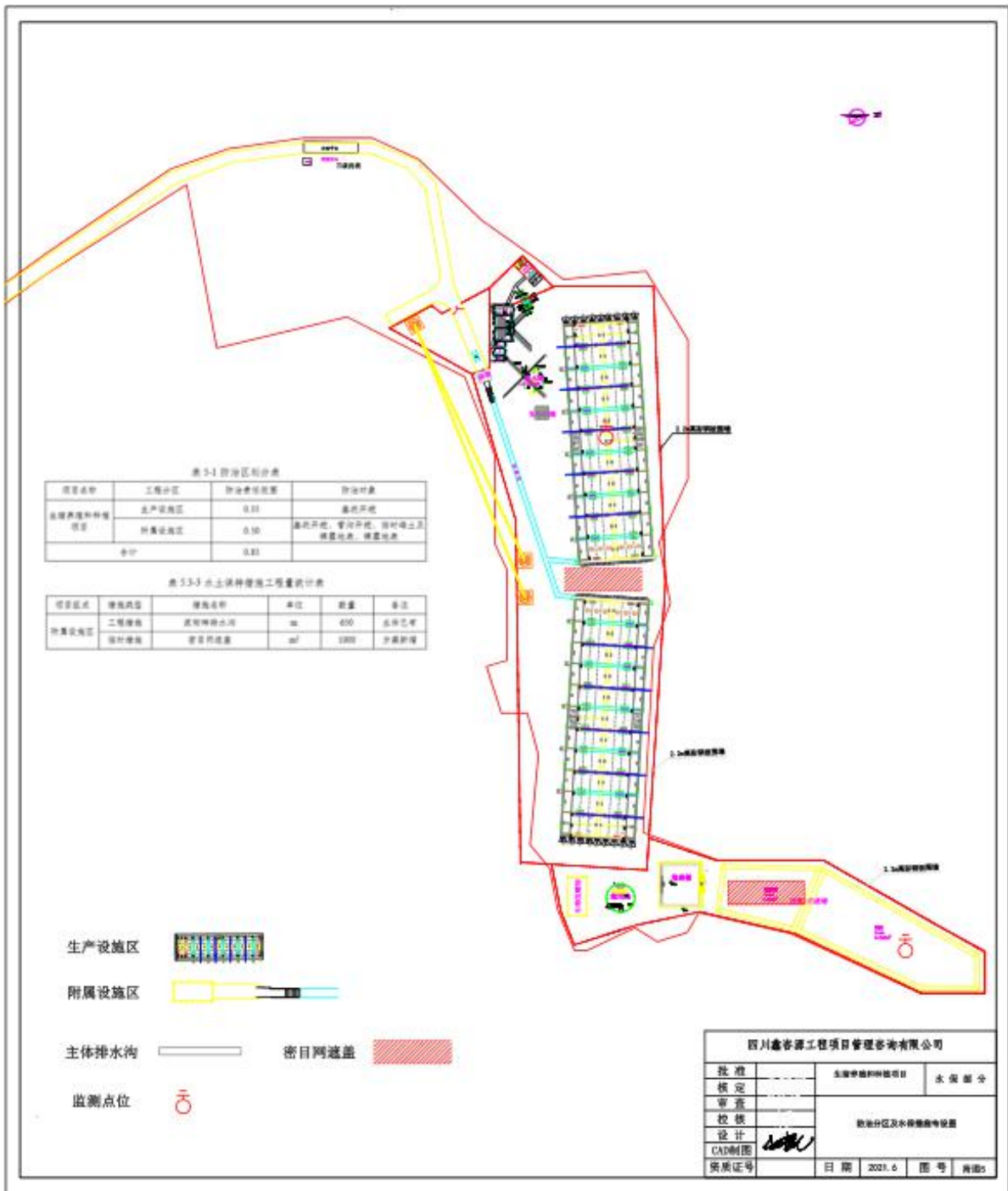
附图 3 防治措施总体布局图