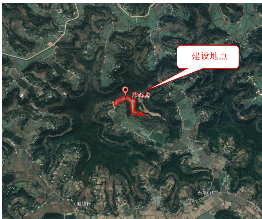
图 2-1 地理位置图