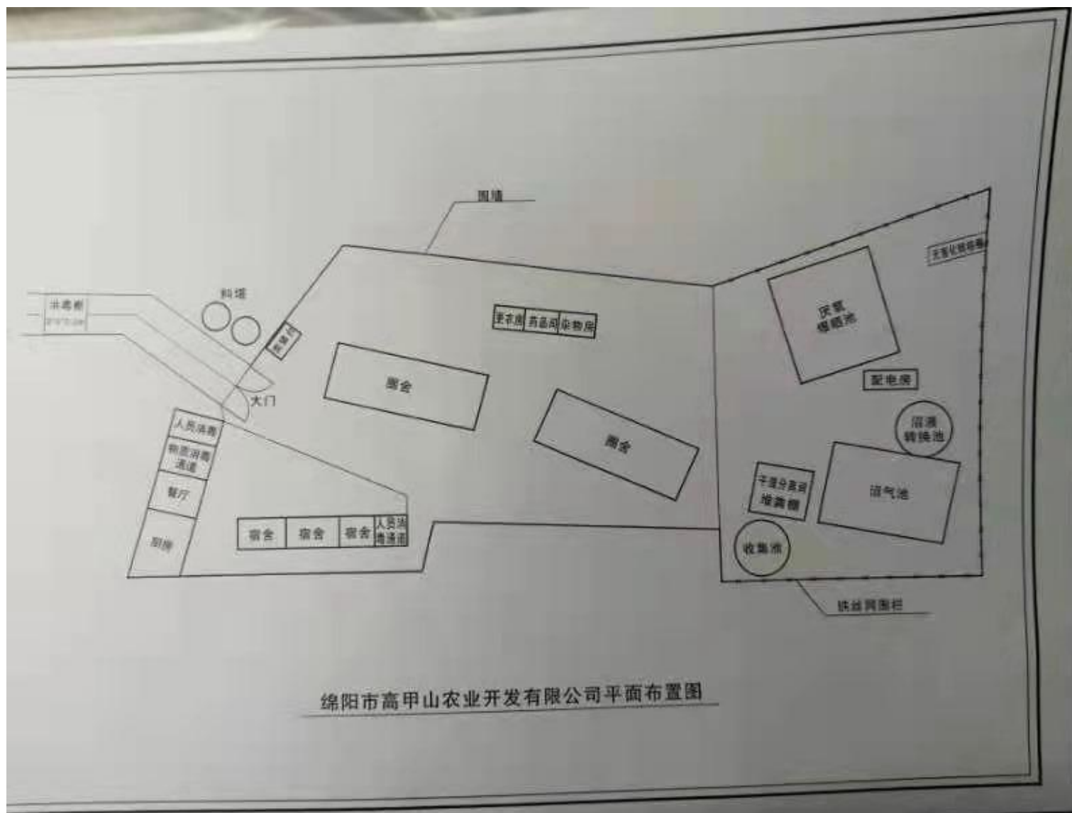
附图2 平面布置示意图