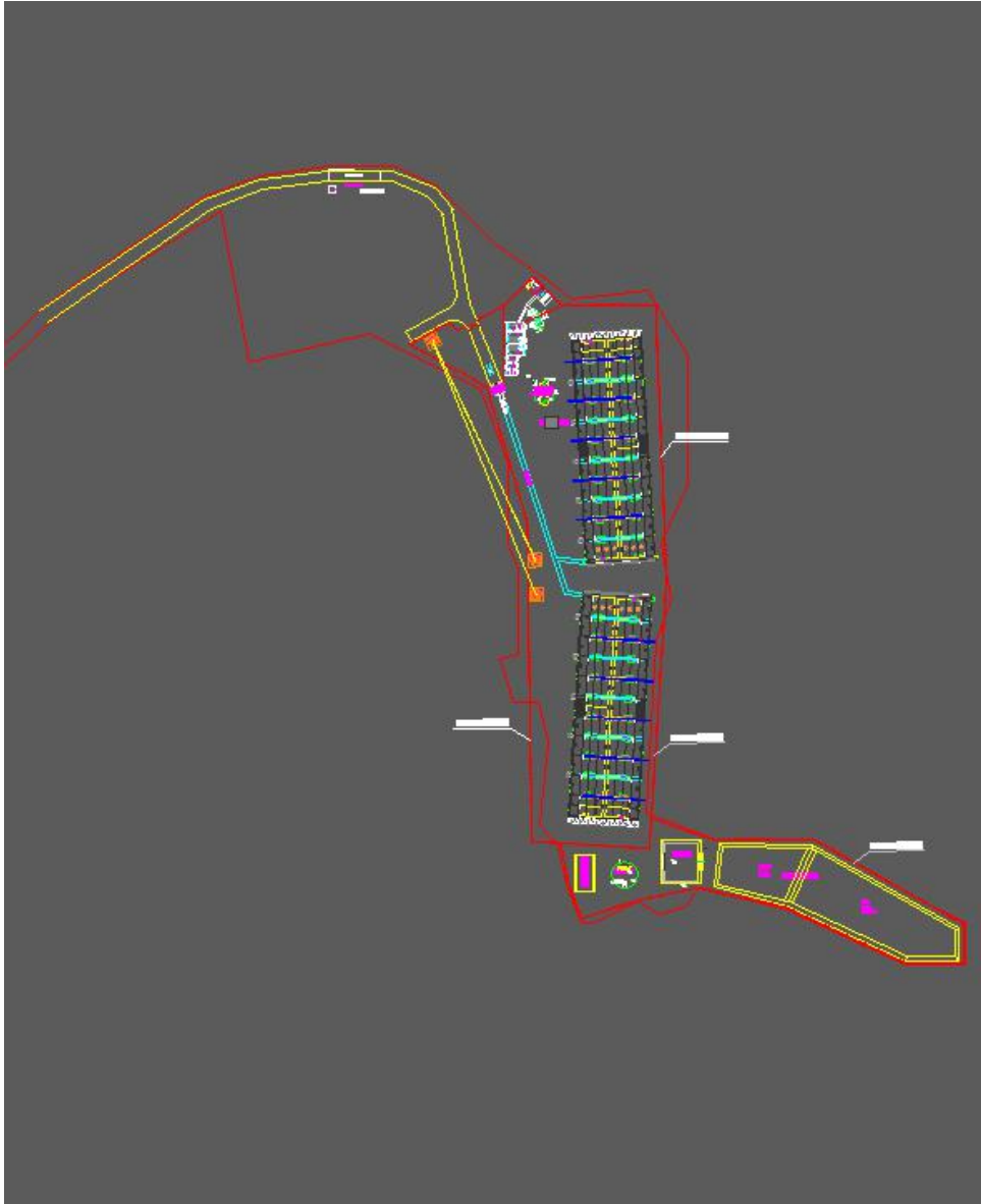
图 2-3 项目总平面布置图